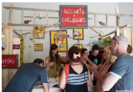
Adopte une équipe – 21 ème édition des Tranes Cévenoles – dernière mise à jour le 6 juin 2018

Quand ? : avant, pendant et après le festival